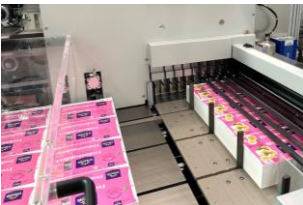
Separieren und Querschneiden