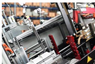
Trennen & Bandieren