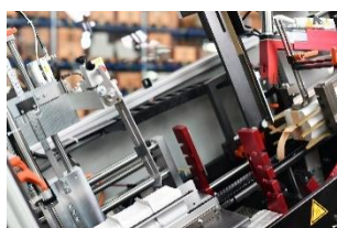
Trennen & Bandieren